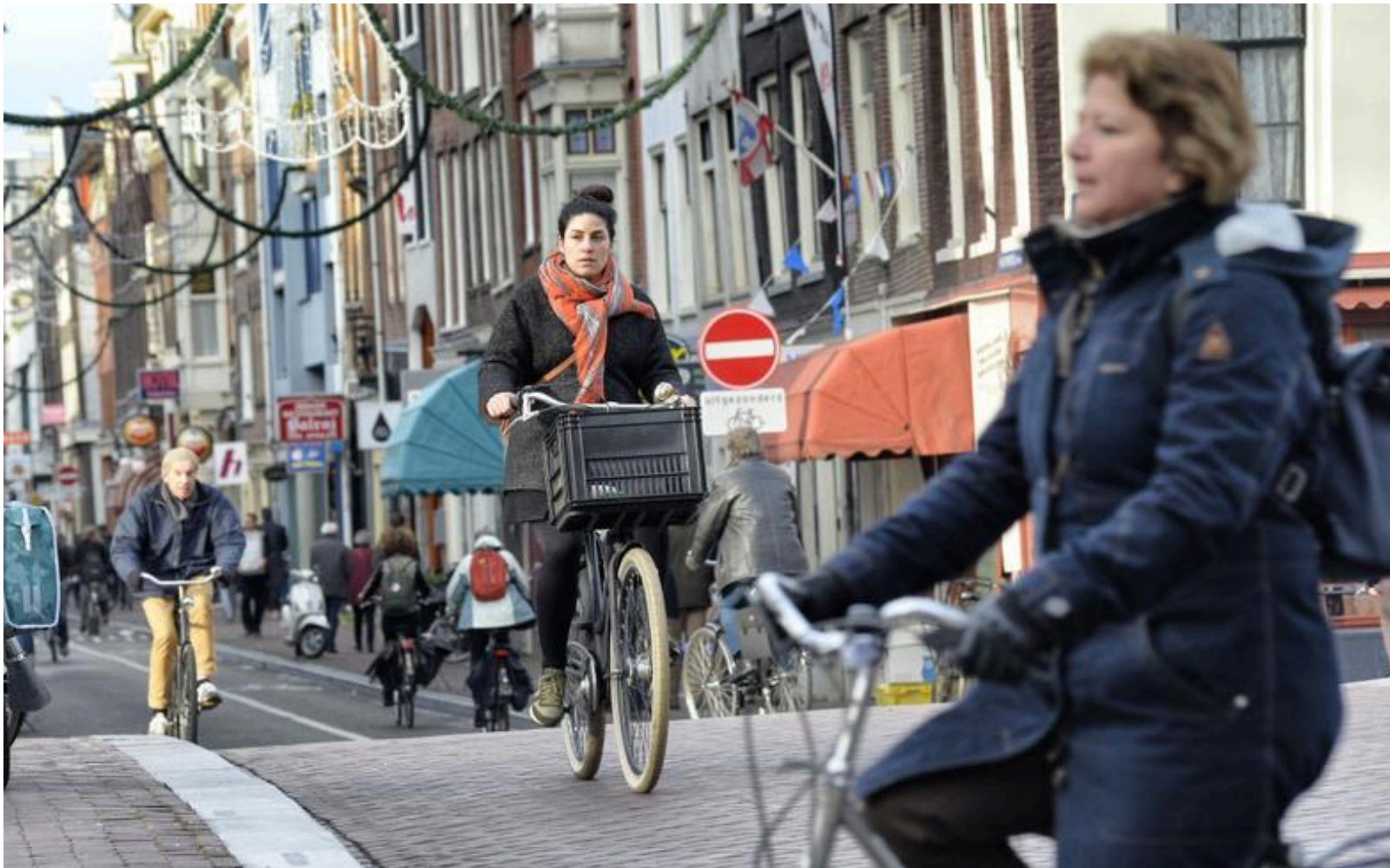
De fiets heeft zijn plek in fietsstad Amsterdam veroverd en bewezen.